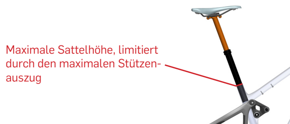
Maximale Sattelhöhe, limitiert durch den maximalen Stützensauszug