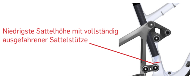
Niedrigste Sattelhöhe mit vollständig ausgefahrener Sattelstütze